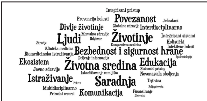
Slika 1. Tzv. „oblak reči“ koji identifikuje ključne reči i fraze povezane sa pristupom „Jedno zdravlje“

Ne postoji globalno prihvaćena definicija „Jednog zdravlja“ (engl. One Health ). Stephen i Karesh (2014) su sprovedi tematsku analizu različitih definicija i opisa „Jednog zdravlja“, u želji da identifikuju ključne koncepte povezane sa ovim pristupom. Rezultati njihove analize su sažeti i vizuelno prikazani na Slici 1. kao tzv. „oblak reči“ koji nasumično prikazuje reči i fraze povezane sa „Jednim zdravljem“, a gde je veličina reči proporcionalna broju pojavljivanja reči (frazu) u kontekstu „Jednog zdravlja“.