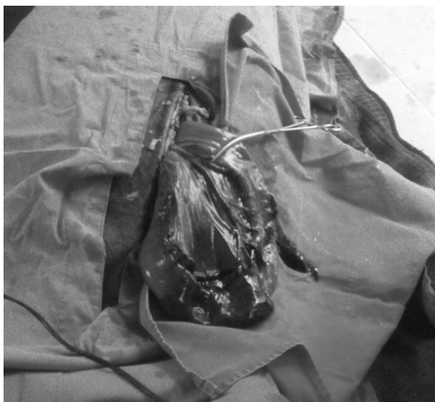
Slika 3. Nekroza dela tankog creva Picture 3. Necrosis of the small intestine

opremljene klinike i operacija radi u inhalacionoj anesteziji (Ducharme, 2002). Zbog poodmaklog stanja i ulaska u šok, u dogovoru sa vlasnikom odlučeno je da se operacija uradi u terenskim uslovima, u injekcionoj anesteziji. Ždrebe je od prethodnog dana bilo na intenzivnoj terapiji (Ringerov rastvor i 5% rastvor glukoze), pri čemu je ponovljena aplikacija fluniksina, penicilina i gentamicina. Nakon obavljene pripreme uvedeno je u anesteziju (acepromazin - 0,01 mg/kg, nakon 20 minuta ksilazin - 1,1 mg/kg, ketamin - 2 mg/kg i diazepam 0,01 mg/kg). Životinja je postavljena u leđni položaj i nakon pripreme operacionog polja urađena medijalna laparotomija u linea alba , rezom dužine 20 cm. Nakon otvaranja trbušne duplje, preko otvora je sipano 2 litra fiziološkog rastvora i potom promenjeni deo tankog creva izvađen ekstraperitonealno. Odmah je uočena nekroza tankog creva u dužini od 30 cm, pri čemu je ovaj deo bio ispunjen sadržajem koji je kasnije identifikovan kao klupko askaridida (slika 3, 4 i 5).