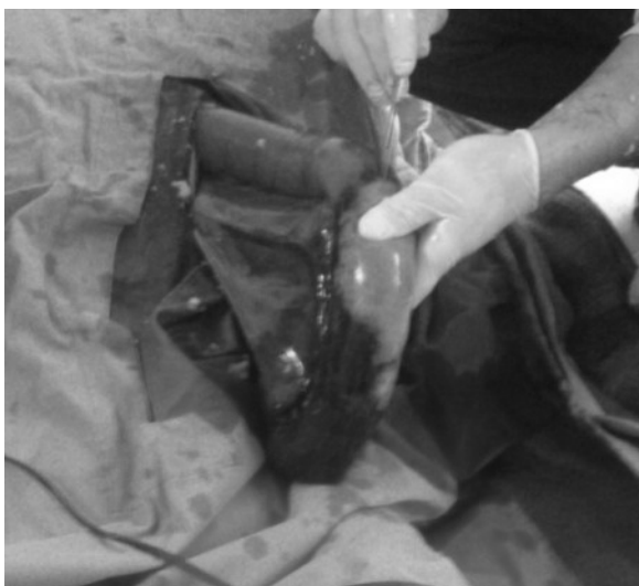
Slika 2. Enterotomija

Picture 1. Obstruction of the small intestine with huddled parasites Parascaris equorum in died foal