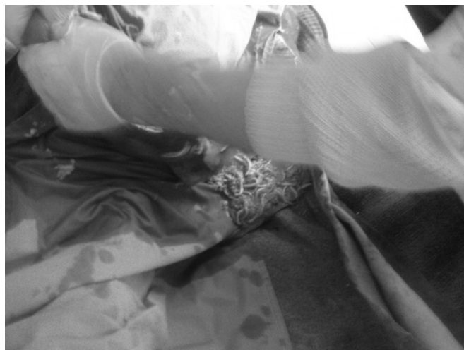
Slika 4. Klupko velikog broja parazita u začepljenom delu creva Picture 4. Clew of great number of parasites in clogged part of the intestine