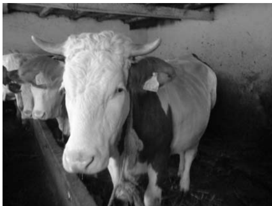
Slika 4. Izlečena krava mesec dana nakon tretmana / Figure 4. Cured cow one month following treatment

Zdravstveno stanje krave desetog dana od pojave prvih kliničkih simptoma bolesti se normalizovalo. Parametri trijasa su bili u fiziološkim granicama. Mokraća je bila svetložućkaste boje.