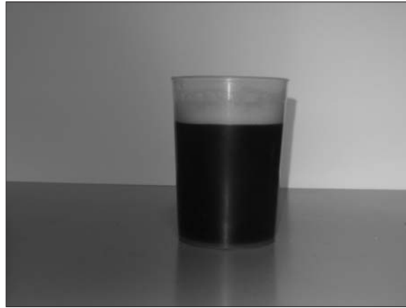
Slika 2. Mokraća obolele krave (hemoglobinurija) / Figure 2. Urine of diseased cow (haemoglobinuria)

nije ustanovljena bolnost. Izmet je bio suv, formiran tamnozeleno-mrke boje. Rektalnim pregledom ustanovljen je meteorizam creva. Na levom bubregu nisu ustanovljene promene u obliku, veličini i konzistenciji. Mokraća uzeta kateterom je bila tamnocrvene-smeđe boje (boje kafe) i veoma je lako penila tokom uriniranja (slika 2). Mleko nije bilo promenjeno. Iz repne vene uzeta je krv za laboratorijsko ispitivanje. Krv je bila vodenasta, svetloružičaste boje.