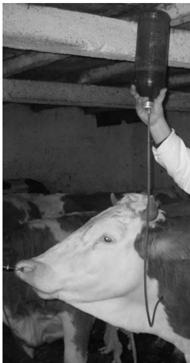
Slika 3. Primena transfuzije krvi / Figure 3. Administering blood transfusion

kraća je bila sve prozirnija svetložuto-ružičaste boje. Sprovedena je antibiotska terapija i intravenozno je ponovljena infuzija glukoze sa preparatom Katosal.