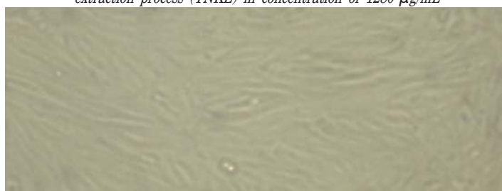
Slika 3. Izgled ćelija VERO u kontrolama bez prisustva ekstrakata timijana /

Figure 2. Appearance of VERO cells (cytotoxic effect) in presence of thyme extract obtained by supercritical extraction process (TNKE) in concentration of 1280 µg/mL