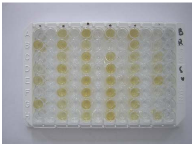
Slika 1. Uzorci krvnog seruma u kojima je ustanovljeno prisustvo antitela protiv goveđeg respiratornog sincicijalnog virusa (BRSV) /

Rezultati dobijeni ispitivanjem 92 uzorka krvnog seruma goveda indirektnom imunoenzimskom probom – iELISA, potvrdili su prisustvo antitela protiv goveđeg respiratornog sincicijalnog virusa (BRSV) kod 46, odnosno 50% ispitivanih uzoraka (slika 1). Kod sedam, odnosno 15,21% uzoraka od navedenih 46 ispitivanih uzoraka krvnog seruma goveda, dokazano je prisustvo antitela samo protiv goveđeg respiratornog sincicijalnog virusa (BRSV).