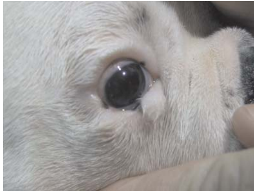
Slika 2. Pas, desno oko, palpebralni koloboma-dermoid / Figure 2. Dog, right eye, palpebral coloboma-dermoid

Detaljnim kliničkim pregledom utvrđeno je da je štene zdravo, nakon čega je pripravljeno za hiruršku intervenciju. Premedikacija je izvršena sa atropin-sulfatom (0,3 mg, SC). Anestezija je izvedena apikacijom kombinacije ksilazina (1 mg/kg, IM) i ketamin hidrohlorida (5 mg/kg, IM).