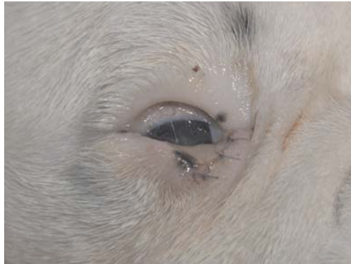
Slika 4. Pas, desno oko nakon ekscizije i hirurške sanacije palpebralnog koloboma dermoida / Figure 4. Dog, right eye following excision and surgical treatment of palpebral coloboma dermoid

Nakon dve nedelje na kontrolnom pregledu uočeno je da je došlo do potpune epitelizacije defekta koji je postojao na korneji na levom oku. Uočena je blaga zamućenost korneje na mestu gde se nalazio dermoid. Na desnom oku defekt na donjem očnom kapku je takođe u potpunosti srastao.