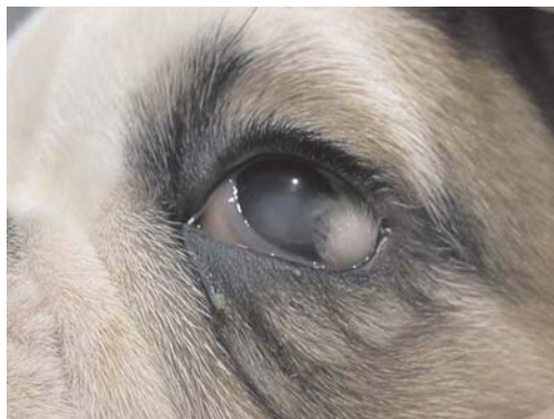
Slika 1. Pas, levo oko, kornealni dermoid / Figure 1. Dog, left eye, corneal dermoid

Adspekcijom očiju i oftalmoskopijom pomoću direktnog oftalmoskopa sa procepom uočeno je da se na rožnjači levog oka, neposredno pored lateralnog očnog ugla, izdignuta iznad površine kornee, nalazi izraslina ovalnog oblika, veličine 5 mm u prečniku, bele boje, neravne površine, prekrivena dlakama. Ova izraslina je remetila potpuno zatvaranje oka i usled iritacije kornee i konjunktive izazivala je pojačano lučenje suza, kao i zapaljenje konjunktive koje se manifestovalo uočljivom hiperemijom i sekretom u lateralnom očnom uglu. Takođe postojanje ove tvorevine dovelo je do edema rožnjače. Na osnovu izgleda i lokalizacije promene klinička dijagnoza bila je limbalni dermoid, koji je zahvatao rožnjaču, konjunktivu i episkleru (slika 1).