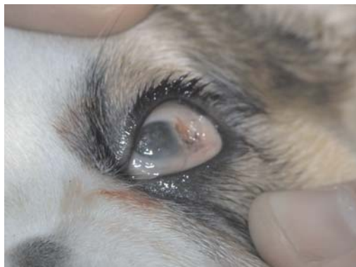
Slika 3. Pas, levo oko nakon ekscizije kornealnog dermoida / Figure 3. Dog, left eye following excision of corneal dermoid

Superfijalna keratektomija bila je metod izbora za sanaciju kornealnog dermoida na levom oku. Nakon fiksacije očne jabučice izvršena je ekscizija dermoidnog tkiva na levom oku (slika 3), kao i palpebre i konjunktive na desnom oku. Ekscizija je izvedena mikrohrurškim instrumentima – kolibri pinceta i Beaver skalpel 64. Sem ekscizije dermoida, na desnom oku izvršena je plastična rekonstruktivna procedura sanacije koloboma, a nastali defekt na palpebri je ušiven pojedinačnim običnim šavovima (Vicril 6-0) (slika 4). Postoperativno su u oko narednih 7 dana aplikovane antibiotske kapi za oči.