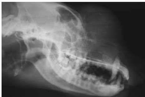
Slika 3. Neoplastični proces na nazalnoj, frontalnoj kosti i maksili / Picture 3. Neoplastic process on nasal, frontal bone and maxilla

lobularne, karfiolaste strukture. Kako ovi tumori poseduju sličnu radiološku sliku neophodno je uraditi njihovu patohistološku analizu. Benigni tumori ne ispoljavaju takvu radiološku sličnost. Osteoma se na snimku prikazuje kao kalcifikovana lobularna masa, hondrosarkom je po intenzitetu senke sličan, samo poseduje manju homogenost, a fibrom se manifestuje kao potpuno litičko-transparentno područje diskretno ograničeno od okoline.