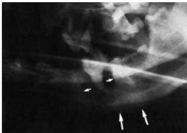
Slika 2. Periapikalna lezija Picture 2. Periapical lesion

svetline, anatomske otvore (foramen incisivum, foramen mentale, akcesorni otvori itd.), a rendgenska slika je samo pomoćno dijagnostičko sredstvo koje se mora dopuniti drugim savremenim specijalističkim metodama pregleda (slika 2).