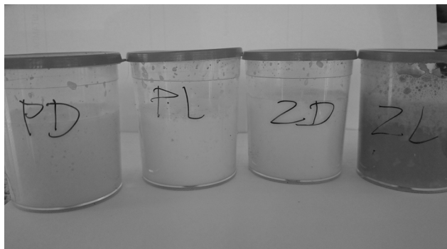
Slika 4. Pojedinačni uzorci mleka iz svake četvrti vimena Picture 4. Individual milk samples from each udder quarter