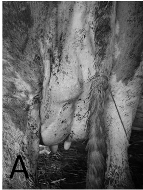
Slika 2A. Izgled promene na oboleloj četvrti vimena

Picture 2A. The occurrence of morphological changes on the affected udder quarter