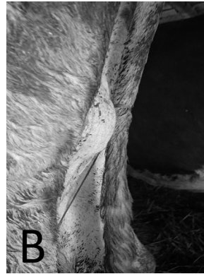
Slika 2B. Izgled promene na oboleloj četvrti vimena

Picture 2A. The occurrence of morphological changes on the affected udder quarter