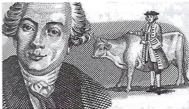
Claude Bourgelat (1712 - 1779) – osnivač prve Visoke veterinarske škole u Evropi