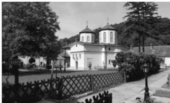
Слика 1. Манастир Раковица, Београд, Република Србија

Манастир Раковица је манастир Српске православне цркве, у оквиру Београдско-карловачке архиепископије, смештен у београдском насељу Раковица. Посвећен је арханђелима Михајлу и Гаврилу (слика1).