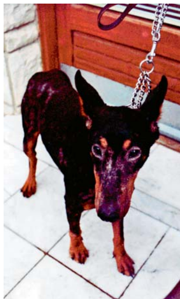
Slika 1. Doberman oboleo od demodikoze, karakterističan fenomen „naočara“ (original) /

Pregledom 76 pasa suspektnih na demodikozu, ustanovljeno je da su svi bili infestirani vrstom Demodex canis . Promene su bile lokalizovane ili generalizovane (slika 1 i 2).