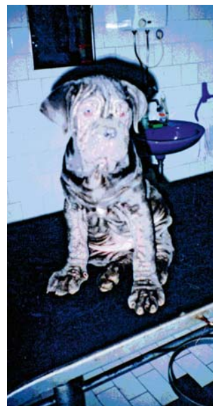
Slika 2. Generalizovana demodikoza kod šteneta napuljskog mastifa (original) /

Figure 1. Dobermann diseased with demodicosis, characteristic bald rings around eyes, so-called spectacles phenomenon (original)